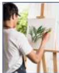
Seni Rupa, Desain, dan Kriya